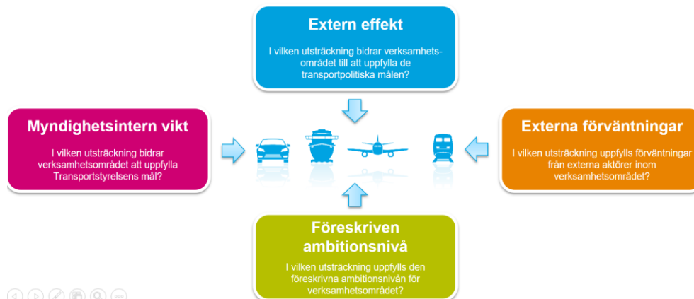
Figur 2. Schematisk beskrivning av modellen.

Såsom framkommer av figur 2 ovan är den valda modellens fyra dimensioner: