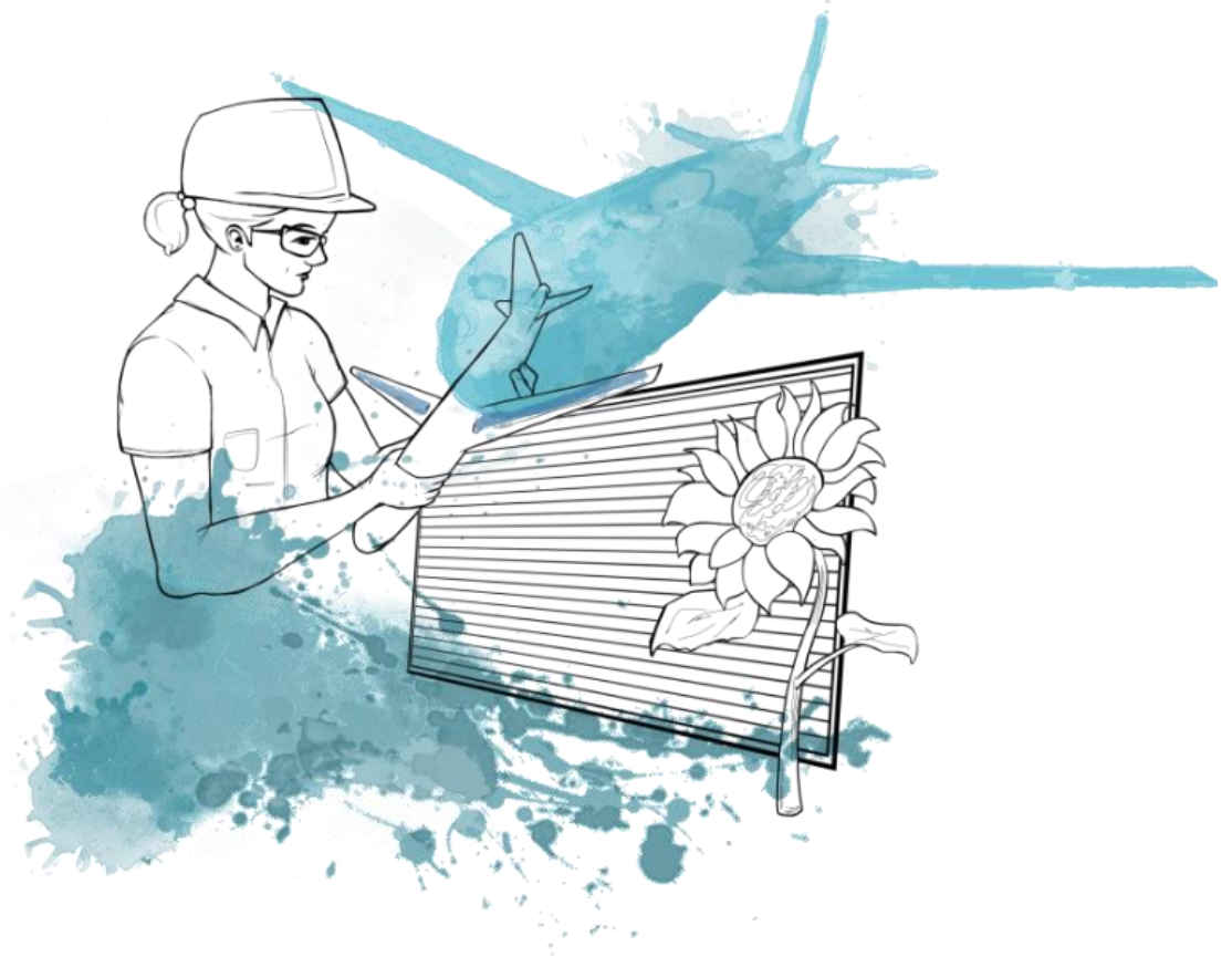
Illustration: Itziar Castany Ramirez/Regeringskansliet