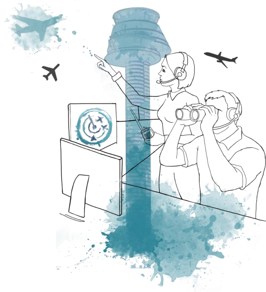
Illustration: Itziar Castany Ramirez/Regeringskansliet