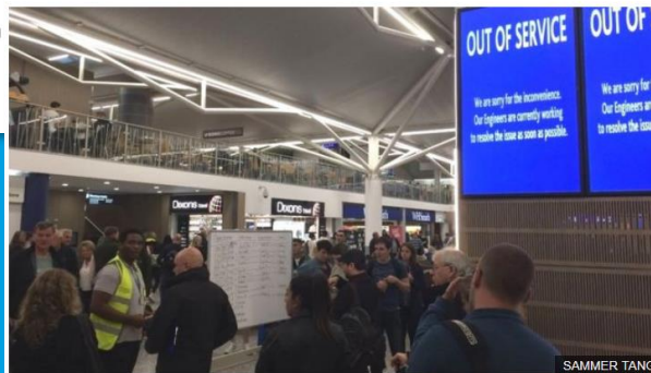
The screens at the airport stopped working on Friday morning

Bristol Airport has blamed a cyber attack for causing flight display screens to fail for two days.