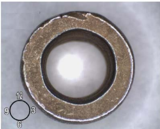
Figure 1: Example of surface irregularities observed on a nut. Overall view.

Underhållspersonal, tillverkare, flygplansägare och operatörer rekommenderas att vid användning av dessa delar göra en noggrann visuell kontroll med avseende på hack och sprickor innan användning, se figurerna 1 och 2 i SIB.