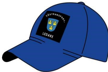
Figur 3. Mössa med skärm.

Byxorna ska vara mörkblå med hellånga ben. Byxorna ska uppfylla kraven i EN 471:2004 klass 1.