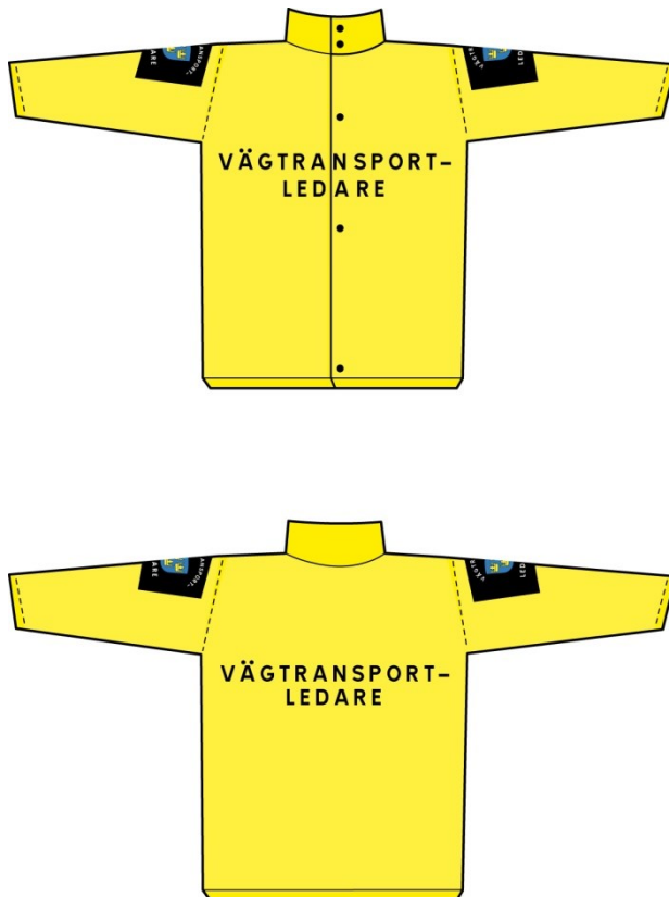
Figur 1. Överdels, fram- och baksida.

Överdels ska förse med texten "VÄGTRANSPORTLEDARE" i versaler, centrerad på två rader, både på fram- och baksidan. Texten ska vara svart och cirka 5 cm hög. På framsidan får dock texten placeras på vänster sida med en mindre textstorlek (cirka 1,5 cm). Ett emblem ska finnas på båda ärmarna cirka 10 cm ned på armen från axelspetsen. Överdels får också ha kort ärm. Överdels ska uppfylla kraven i EN 471:2004 klass 3. Överdels ska vara gul, dock kan den nedersta delen ha samma färg som byxorna.