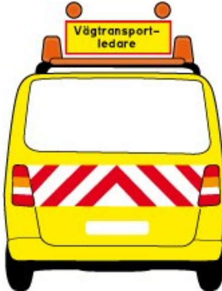
Figur 2. Röda reflekterande och vita fält baktill